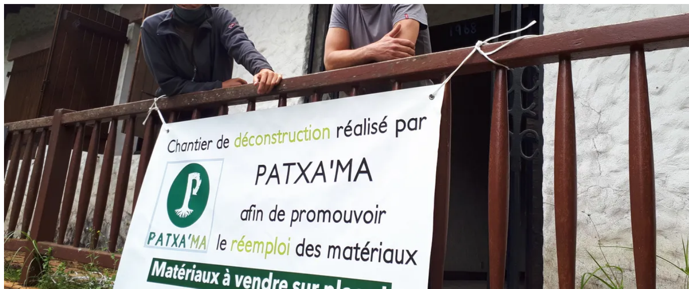
L'association Patxa'ma intervient dans ce chantier à Anglet pour démonter des matériaux qui sont réutilisables

Le secteur du bâtiment est considéré comme le premier producteur de déchets, avec environ 40 millions de tonnes par an en France. Environ la moitié de ces déchets proviennent des démolitions. Pourtant, les matériaux des bâtiments voués à la destruction ne sont pas tous forcément hors d'usage : une partie d'entre eux est bien souvent réemployable en l'état, après révision.