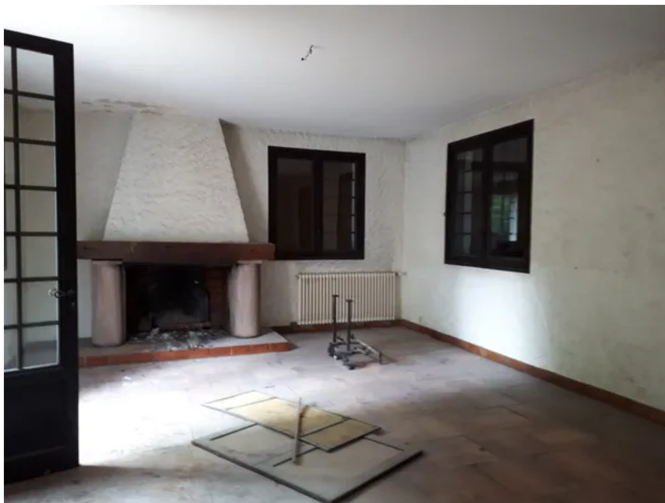
L'une des deux maisons dans laquelle Patxa'ma intervient à Anglet