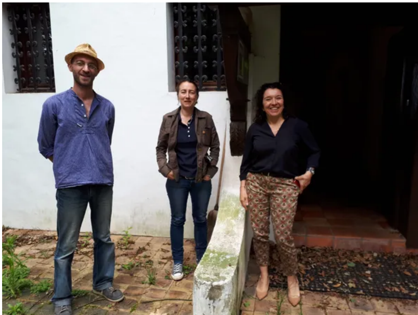
L'association IDRE et Maneo Habitat sont partenaires sur ce projet

Cette opération à Anglet vise à sauver entre 5 et 10 tonnes de matériaux de la benne à déchets. Les promoteurs vont également travailler avec l'entreprise bidartar Goyhetche, spécialisée dans le recyclage des gravats et déchets du bâtiment.