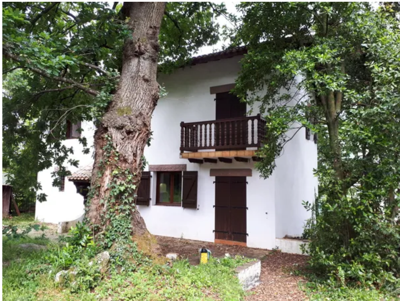
Avant la construction du futur programme immobilier, cette maison va faire l'objet d'une déconstruction

Mais avant de débiter les travaux, deux villas datant des années 70 doivent être détruites. "Ces maisons comportent des matériaux nobles, qu'on ne voulait pas casser" , raconte Céline Lespes, de Maneo Habitat. "On s'est dit qu'on ne pouvait pas envoyer tout cela à la benne et polluer encore notre planète. On s'est donc lancé dans cette démarche de déconstruction pour réemployer le maximum de matériaux avant de commencer notre bâtiment" .