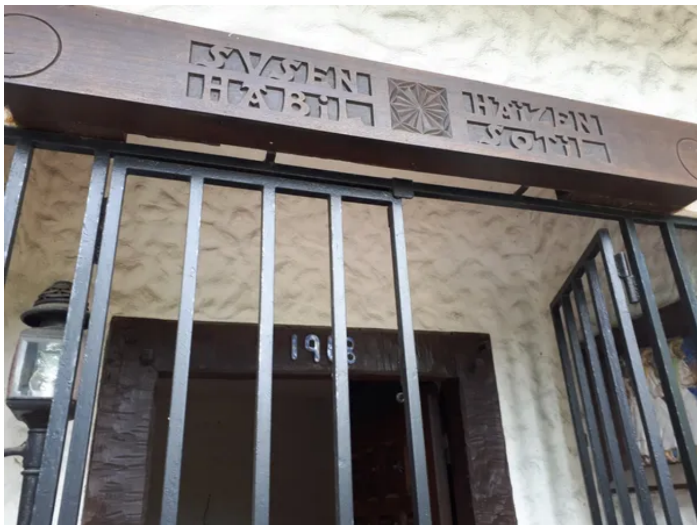
L'une des deux maisons dans laquelle Patxa'ma intervient à Anglet

Le but de Patxa'ma n'est pas de faire de la récupération gratuite : la déconstruction requiert du travail et un savoir-faire spécifique pour "déposer" proprement les matériaux, afin qu'ils soient réutilisables.