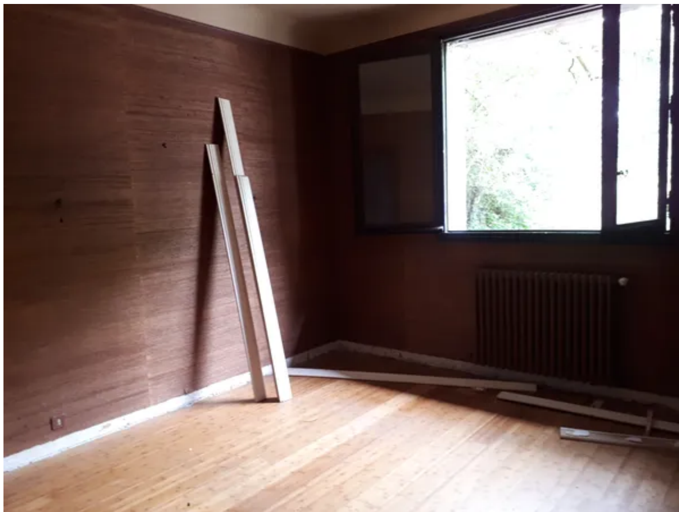
L'une des deux maisons dans laquelle Patxa'ma intervient à Anglet